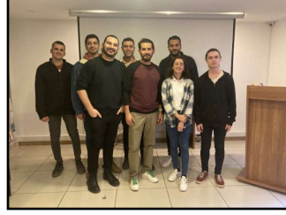
TED İZMİR TEMSİLCİLİĞİNDEN HABERLER