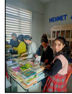
SOSYAL SORUMLULUK PROJESİ