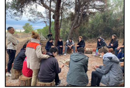
ORMAN OKULU'NDA FELSEFE